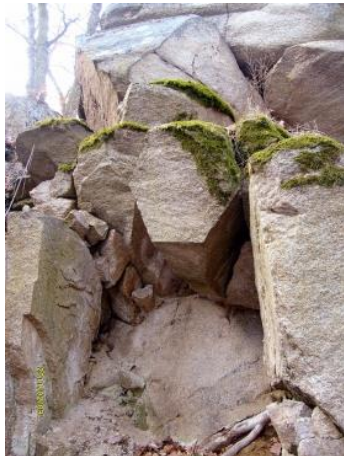
Pyramidální vrchy v okolí Šobesu