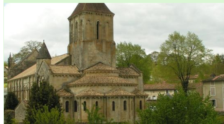
Melle - kostel St. Hilarie

K městečku Lusignan a k místnímu hradu se váže pověst o vile Meluzině a jejím setkání s jejím budoucím manželem Raimondinem, zakladatelem rodu Lusignanů, jenž dosáhl vrcholu své slávy na konci 12. století, kdy se Guy de Lusignan stal Jeruzalémským a poté i Kyperským králem. Tento rod má vztah i k dějinám českého středověku. V nedalekém městečku Civray se nalézá překrásný románský kostel Saint-Nicolas z počátku 12. století se sochařsky bohatě zdobeným průčelím. Město Melle bylo známé