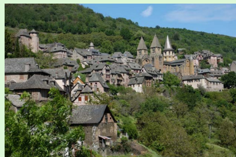
St. Jean Pied de Port

Středověké pohraniční francouzské městečko Sauveterre s dochovanými hradbami a obrannou věží na úpatí Pyrenejí tvořilo již od 11. století významný bod vikomtsví Béarn. Ve 12. století zde byl na ostrohu nad řekou postaven opevněný románský kostel St-André a poté i středověký špitál pro poutníky do Santiaga de Compostela. V baskickém městečku Saint-Jean-Pied-de-Port , založeném ve 12. století na staré římské cestě vedoucí přes Pyreneje, se nachází románský kostel Sainte-Eulalie a hrad