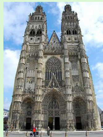
Tours - katedrála sv. Gatiena

je známé hlavně díky působení hraběte z Poitiers, jenž je považován za jednoho z nejznámějších trubadúrů Aquitánie – dědečka věhlasné Eleonory Aquitánské, zakladatelky Dvorů lásky a manželky krále francouzského a anglického. Nejstarší památkou města je raně křesťanská křestní kaple sv. Jana z poloviny 4. století. Z 11. století pak pochází krásný románský kostel P. Marie s bohatě sochařsky zdobenou fasádou, dále kostely sv. Hilaria a sv. Radegundy, klášterní kostel sv. Jana de Mortierneuf a gotická katedrála sv. Petra ze 13. století. Nocleh v hotelu Ibis na severním okraji města.