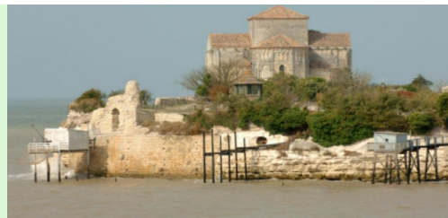
Talmont sur Gironde

Saint-Émilion – Saint-Jean de Sorde – Abbaye d'Arthous – Bayonne (nocleh)