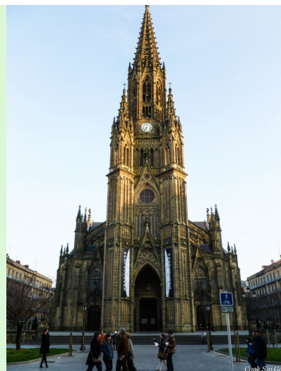
San Sebastian - katedrála