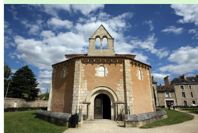
Poitiers Baptistere Saint-Jean

Město Tours bývá nejčastěji spojováno se sv. Martinem, jemuž byla zasvěcena původní bazilika již ze 4. století. Na jejích ruinách, z nichž zůstala dodnes jen věž Karla Velikého a krypta s hrobem svatého Martina, byla vystavěna koncem 19. století nová bazilika v neorománsko-byzantském slohu. Ze 13. století pochází katedrála svatého Gatiena s přílehlým klášteřem La Psalette. Poitiers