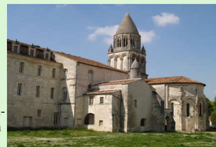
Saintes - Abbey aux Dames

Ve městě Saintes byl v 11. století vystavěn na poutní Svatojakubské trase kostel St-Eutrope s ostatky mučedníka sv. Eutropa, jenž patří dodnes mezi významné křesťanské svatyně regionu. Katedrála sv. Petra vznikla na základech předkřesťanské stavby z 6. století, jež byla nahrazena v 11. století novým kostelem, a přibližně ve stejné době byl postaven i ženský klášter benediktinek s opatstvím Abbaye-aux-Dames, jenž se brzy stal nejproslulejším a nejmocnějším ženským klášteřem francouzského jihozápadu. Město Cognac je známé hlavně díky výrobě francouzského koňaku, ale i díky narození krále Františka I., jenž pro