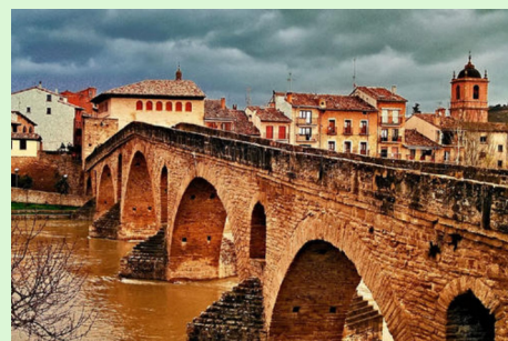
Puente la Reina

Středověcí poutníci pokračovali z Pamplony dále na jih k mostu u městečka Puente La Reina , kde se sbíhaly všechny Svatojanské trasy z Francie a spojovaly do tzv. Camino francés, tj. Francouzská cesta. K nejznámějším památkám v tomto místě patří kromě románského kostela sv. Kříže také románský most s šesti oblouky. Město San Sebastian založil navarrský král Sancho koncem 12. století jako královský námoř-