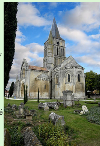
Aulnay - bazilika sv. Petra

již od dob Karla Velikého pro své stříbrné doly, jichž využívali poté i francouzští králové. Nejvýznamnější pamětihodností města je románský kostel St-Hilaire z 12. století, pro svou výjimečnost zařazený v roce 1998 do seznamu památek UNESCO, jenž tvořil spolu s románským kostelem sv. Petra důležitou zastávku na Svatojakubské cestě do Santiaga de Compostela. Na okraji městečka Aulnay se nachází románská bazilika sv. Petra – další důležitá zastávka na Svatojakubské cestě v kraji Poitou. Nedaleko odsud leží i La Croix Hosanniere – gotická pohřební stavba ze 14. století. Nocleh v hotelu P'tit Déj na předměstí Saintes.