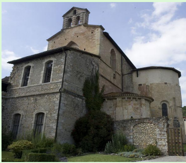
Opatství Saint Jean de Sorde