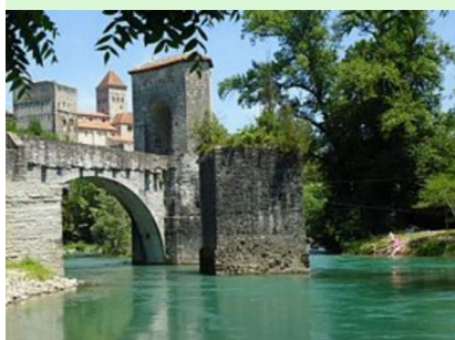
Sauveterre de Béarn

Sauveterre-de-Béarn – St-Jean-Pied-de-Port – Roncesvalles – Pamplona (nocleh)