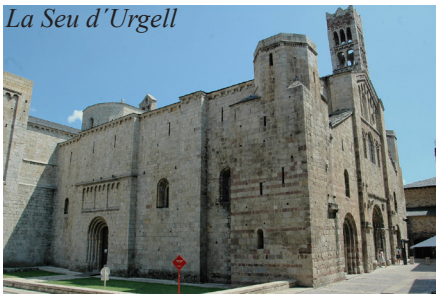
La Seu d'Urgell

hradu i románská katedrála Santa Maria del Romeral a dochované středověké hradby s bránou Puerta de Luzán. Lleida je jedno z nejstarších katalánských měst. Má několik pozoruhodností - románsko-gotickou katedrálu Sen Vella, hrad, jehož původ sahá do 9. stol., několik středověkých kostelů a slavnosti šneků koncem května. V městě La Seu d'Urgell , jež se