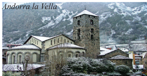
Andorra la Vella

nalézá již pod Pyrenejemi, stojí nejstarší katalánská katedrála a klášter La Seu s křížovou chodbou se sochařskou výzdobou z 11. století. Okolo kláštera vedou mnohé malebné uličky s historickými domy s loubími, cennými fasádami a se zdobnými mřížemi. Hřeben Pyrenejí budeme přejíždět z Katalánska do Francie přes Andorru , jež patří mezi sedm nejmenších států Evropy a vyniká svou úchvatnou polohou v jednom z pyrenejských údolí ve výšce nad 1000 m. Na závěr dne je plánován pomalý průjezd jejím hlavním městem Andorrou la Vella s krásnými výhledy do krajiny a cesta podhůřím francouzských Pyrenejí až k městu Foix v Languedoku, kde je zajištěn nocleh v hotelu P'tit déj ** na severním okraji Foix.