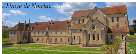
Abbaye de Noirlac

Centrem Nevers je Place Carnot s vévodským palácem z 15. století a katedrála St-Cyr, v níž se otiskly stavební slohy 10. – 16. století. Jižněji, v krajině Berry, se nachází osamocený cisterciánský klášter Abbaye de Noirlac, založený skupinou mnichů z