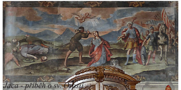
Jaca - příběh o sv. Omsy

byl v 5. století papežem vyslán evangelizovat Gaskoňsko. V místě jeho umučení Vandaly nechali postavit benediktinští mniši v 8. století nejprve kapli, jež se stala v 10. století základem pro vznik klášterního komplexu St-Sever. Velmi cenná je hlavně výzdoba interiéru a hlavic sloupů klášterního kostela z počátku 11. století, díky čemuž byl klášter zapsán i do Seznamu památek UNESCO. Na závěr dne je plánována prohlídka katedrály a románské svatyně, snesené z úpatí hory Sarsa, ve městě Jaca , a to již na území Španělska. Přejezd pyrenejského sedla nabídne mnohé krásné výhledy do horských údolí. Nocleh v hotelu Oroel **** v centru města.