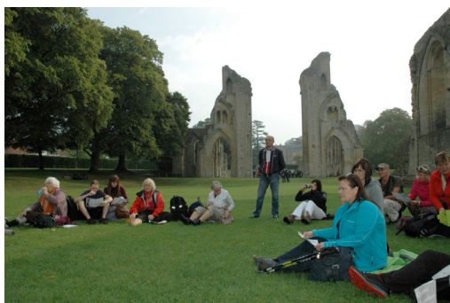
Glastonbury, hrob Artuše a Ginevry v katedrále

Město Glastonbury bývá spojováno hlavně s legendou o králi Artušovi. V opatství byla ve 12. století v katedrále nalezena dvě těla, přisuzovaná Artušovi a Ginevře, což mělo být stvrzením toho, že Glastonbury je původním Avalonem. Předpokládá se, že opatství Glastonbury Abbey bylo původně keltským druidským seminářem a poté klášteřem ze 4. – 5. století, který podle legendy založil Josef Arimatejský, jenž sem měl přivést ze Svaté země Svatý grál a Longinovo kopí, jímž byl probodnut bok Krista na kříži. Na pozemcích opatství také roste vzácný druh hlohu, jenž údajně zázračně vypučel z berly sv. Josefa Arimatejského. Hrad Tintagel je také spojován s životem krále Artuše a s rytíři kulatého stolu. Podle jednoho z mýtů se měl v těchto místech Artuš narodit jako syn krále Uthera Pendragona a Igrainy. Pod hradem se nachází ostrůvek s keltskou svatyní a u moře pak vyhledávaná Merlinova jeskyně, v níž má dodnes pobývat jeho duch. V současné době je hrad Tintagel považován za hlavní centrum keltské mytologie.