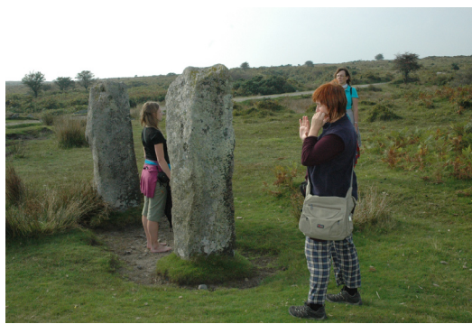
Hurlers Stone Circle