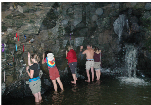
vodopád Sv. Nectana